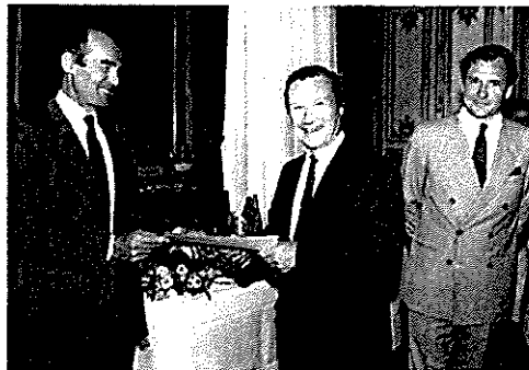
Les accords du 27 septembre 1985 qui ont abouti sur le « Statut des Carpa » puis au décret du 13 mars 1986 rendant la Carpa obligatoire.

2 - une lettre qui a scellé ces accords fut établie sous la signature du Garde des Sceaux, Robert Badinter, le 27 septembre 1985.