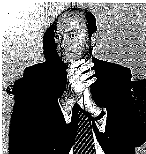
M. Jacques TOUBON, Ministre de la Justice

Vos Services, je le disais il y a un instant, ont été tout particulièrement attentifs au respect d'une concertation totale dans le cadre d'un débat contradictoire. A diverses reprises, nous avons été réunis à la Chancellerie au fur et à mesure de l'avancement des discussions qui se sont échelonnées et ce, sur plus d'une année.